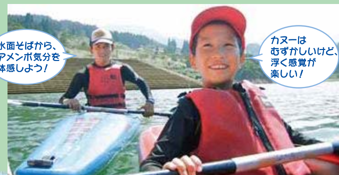
水面をばから、 アメンボ気分を 体感しよう!