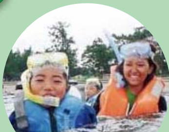
シュノーケリングで、 僕らは水中探検隊!

ガイア自然学校とやま校は、大自然のなかで子どもたちを自由に大らかに遊ばせようと活動している団体です。富山県内の子どもたちを対象に、春夏秋冬さまざまなフィールドで冒険イベントや宿泊キャンプなどの自然体験活動を行っています。活動には父兄は同行せずに、子どもたちの自立心の育成をめざしています。テントの設営や道具の準備・管理もすべて自分たちで協力して行い、ボランティアの大学生が自然学校の活動をサポートしています。