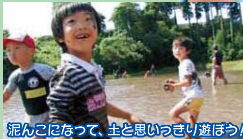
泥んこになって、土と思いきり遊ぼう!