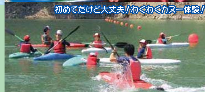
初めてだけど大丈夫!わくわくカヌー体験!