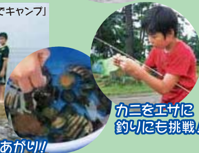
カニをエサに 釣りに挑戦!