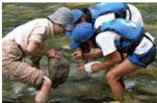
▲8月21日(金)黒部川水生生物などによる水質調査(上流部)。水生生物いる?いる数えま〜す。