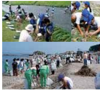
▲7月5日(日)荒俣海岸清掃・海浜植物調査・高橋川水生生物などによる水質調査。 地域の皆さんと共に清掃活動をしました。また、今年は新しく市内平野部を流れる川の水質測定・環境調査もしました。