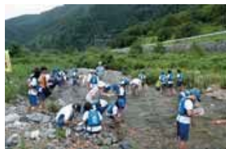
▲8月9日(日)黒部川水生生物などによる水質調査(中流部)・河川清掃。 音谷川は本当にきれいな川だなあ!