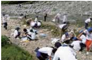
▲8月3日(月)北アルプス源流調査。 浄土川のウズムシの数にビックリ。