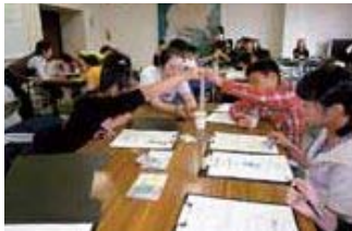
▲6月7日(日)結団式。 活動のスタートは観測器具の使い方から学習しました。