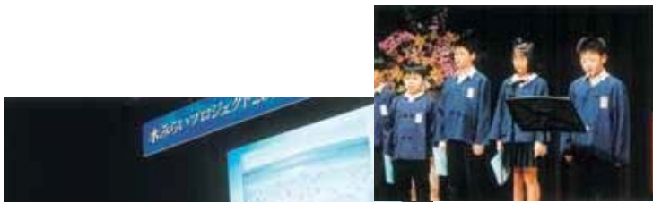
▲いろんなプロジェクトを紹介。