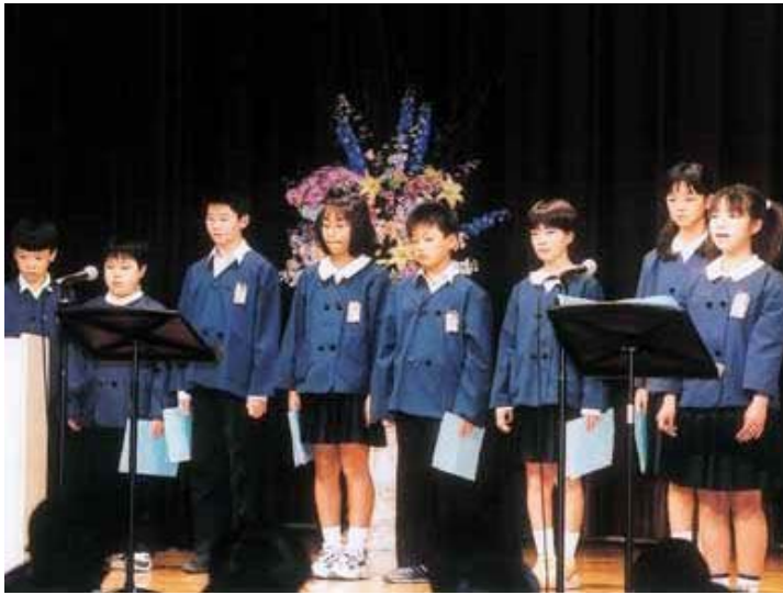
▲浅井キッズの元気な発表。