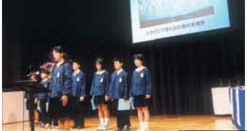
▲いろんな活動にみんなビックリ。